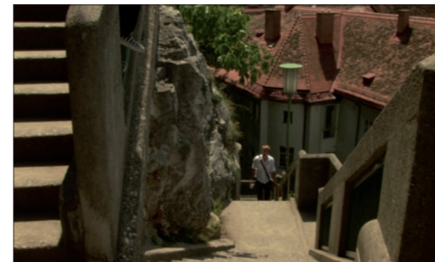
Auf der Schlossbergstiege