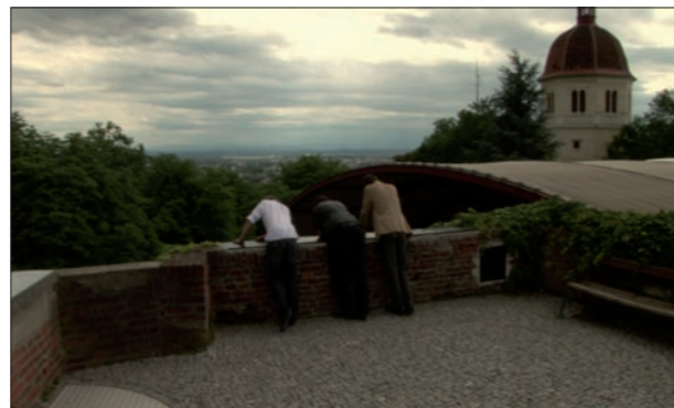
Spurensuche auf dem Schlossberg