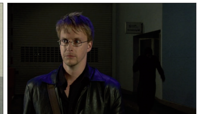
Hierzer auf der Lauer