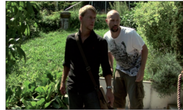
Auf der Suche nach dem Mörder